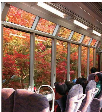
「きらら」号車内ともみじのトンネル

帰路も叡山電車をご利用いただくと、昼間の景観もライトアップしたもみじのトンネルもお楽しみいただけます（叡山電鉄営業課・小寺氏談） 出町柳駅から約三十分。貴船川沿いの豊かな自然の中で色づく紅葉は、電車の個性と共に、他とはひとあじ違う趣を感じさせてくれます。