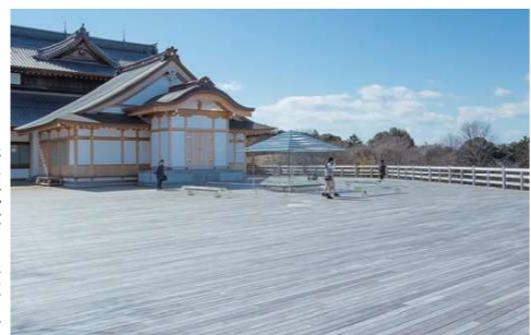
青龍殿前の大舞台