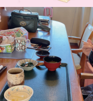
食事を楽しむ様子