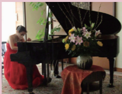
コンサートの様子

11月1日に、ラウンジのリニューアルを記念したコンサートを開催いたしました。密を避けるため公演を3回に分ける等、新型コロナウイルス対策を万全におこないました。