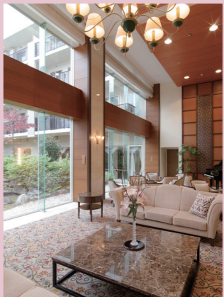
リニューアルされたラウンジ

平成21年11月にホームが開設されて12年、今年ラウンジの絨毯と壁面をリニューアルしました。