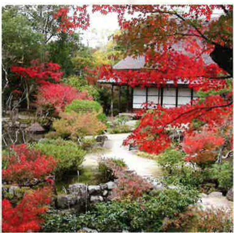
秋の紅葉と三秀亭

ます。前園から後園へは細い路地を通りますが、路地を抜けたときの風景の広がり、依水園の大きな魅力です。庭の中で私が一番好きな点も、この景観の変化でしょうか。